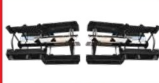
4. ชุดใบพรวนดินลงโคลน