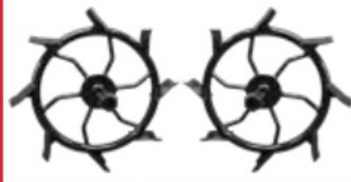
2. ชุดล้อเหล็ก 3. ชุดล้อยาง หน้าคู่ + หลังคู่ ( ในภาพสินค้า )