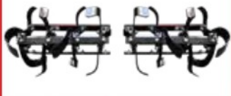
1. ชุดใบพรวนดิน